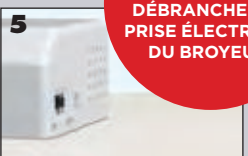
5 Mettez en marche sur la position ON.

AVANT TOUTE MANIPULATION : DÉBRANCHER LA PRISE ÉLECTRIQUE DU BROYEUR.